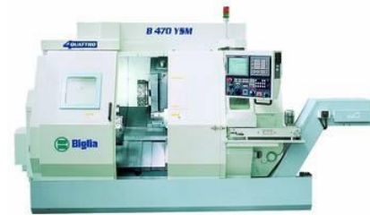
Mehrachsen Drehcenter Biglia B 470 YSM

Spindeldurchlass 65mm, mit LNS Stangenlader