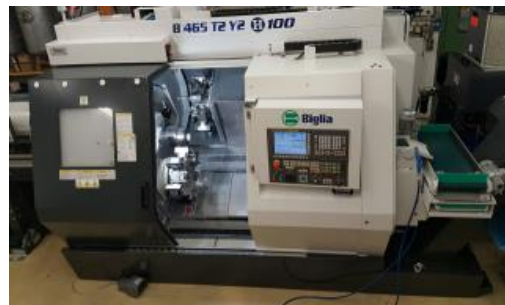
Mehrachsen Drehcenter Biglia/Honauer B 465 2T 2Y H100

(Spezialmaschine: Modifikation durch Honauer+Co. AG) mit LNS Stangenlader + Kühlwasser Aufbereitung