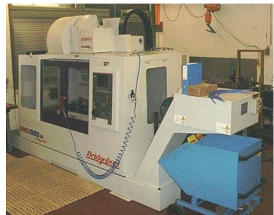
Bridgeport VMC 1000 / 30 Digital

Spindel 6000 - 10000 min-1 Bearbeitungscenter vertikal mit Werkzeugwechsler für 22 + 30 Werkzeuge x=1020mm, y=510mm, z=500mm