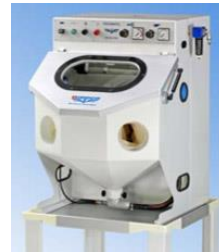
iepcO PEENMATIC 550