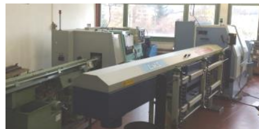
Drehcenter Feeler c 80-2S / Schaublin 110-CNC-R

6Stk. angetriebene Werkzeuge mit C-Achse, Rückseitenbearbeitung Spindeldurchlass 32mm