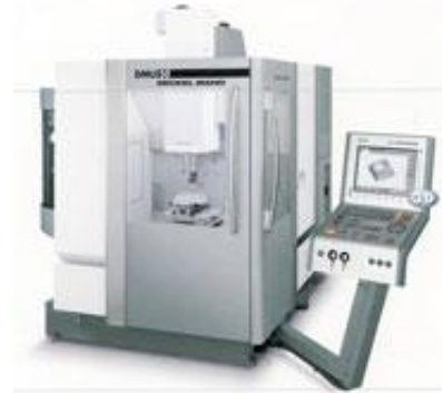
DMU 50 / 5- Achse-Fräsmaschine

X-Achse= 500 mm, Y-Achse= 450mm, Z-Achse= 400mm Tisch= D630 x 500 mm Schwenkbereich B-Achse= -5 / +110°, C-Achse= 360° Spindeldrehzahl= 20 - 14000 U/min Werkzeugplätze= 16 Stück