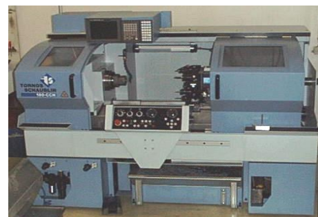
Schaublin 180-CCN / TEACH-IN

mit angetriebenen Werkzeugen Spindeldurchlass 42mm Drehdurchmesser 210mm, Z=650mm