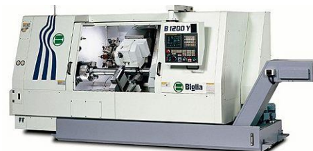
Mehrachsen Drehcenter Biglia B 1200 YS