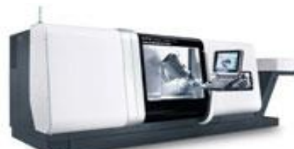
Drehcenter DMG CTX beta 1250 TC

Spindeldurchlass 102mm / Drehdurchmesser bis 390mm