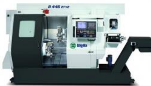
Mehrachsen Drehcenter Biglia B 446 2T 2Y

Spindeldurchlass 51mm, , mit LNS Stangenlader