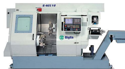
Mehrachsen Drehcenter Biglia B 465 Y2-8

Spindeldurchlass 80mm, mit LNS Stangenlader