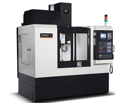
Campro Smart 2 3-Achsen-Fräsmaschine