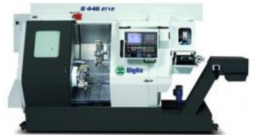
Mehrachsen Drehcenter Biglia B 446 2T 2Y

Spindeldurchlass 51mm mit LNS Stangenlader + Kühlwasser Aufbereitung