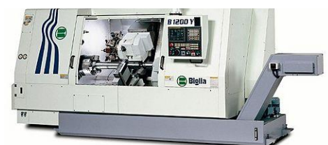
Mehrachsen Drehcenter Biglia B 1200 YS

Drehdurchmesser bis 490mm / Drehlänge 1200mm Spindeldurchlass 102mm