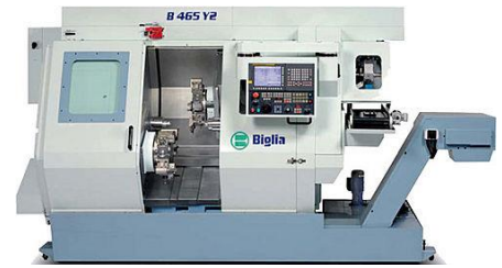
Mehrachsen Drehcenter Biglia B 465 Y2-8

mit LNS Stangenlader + Kühlwasser Aufbereitung