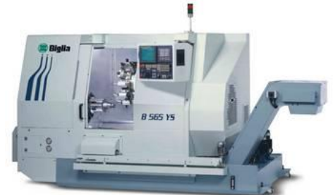
Mehrachsen Drehcenter Biglia B 565 YS

Spindeldurchlass 65mm / Drehdurchmesser bis 300mm