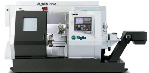
Mehrachsen Drehcenter Biglia B 465 2T 2Y

Spindeldurchlass 80mm mit LNS Stangenlader + Kühlwasser Aufbereitung