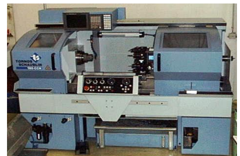
Schaublin 180-CCN / TEACH-IN