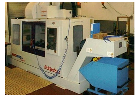
Bridgeport VMC 1000 / 30 Digital

Bearbeitungscenter vertikal mit Werkzeugwechsler für 22 + 30 Werkzeuge Spindeldrehzahl 6000 - 10000 min-1 x=1020mm, y=510mm, z=500mm