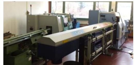
Drehcenter Feeler c 80-2S / Schaublin 110-CNC-R

mit Rückseitenbearbeitung Spindeldurchlass 35mm