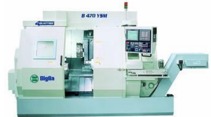
Mehrachsen Drehcenter Biglia B 470 YSM

Spindeldurchlass 65mm, mit LNS Stangenlader