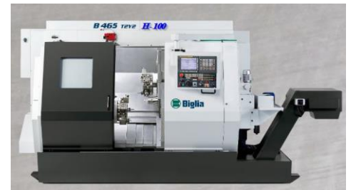
Mehrachsen Drehcenter Biglia/Honauer B 465 2T 2Y H100

Spindeldurchlass 102mm (Spezialmaschine: Modifikation durch Honauer+Co. AG) mit LNS Stangenlader + Kühlwasser Aufbereitung